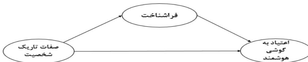
شکل شماره ۱. مدل فرضی پژوهش